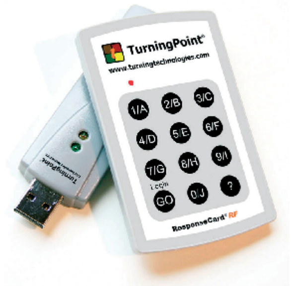
✳ Boîtiers et Récepteur Radio USB