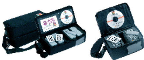
✳ Packs TURNINGPOINT