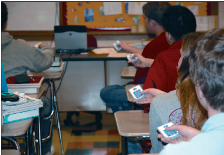
✳ TURNINGPOINT en milieu scolaire